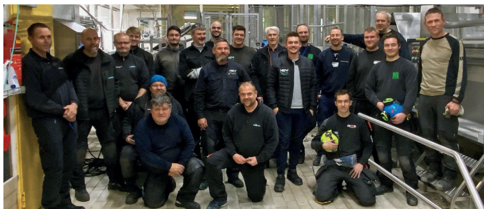
HSV Combi's montage team i Norge.