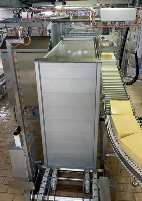
Saltreoltømmere og reolvaskemaskine.