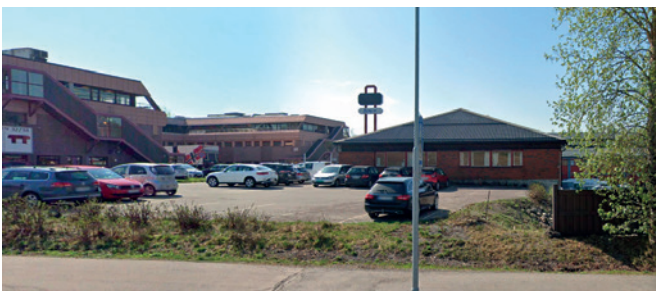
Salgskontoret i Oslo.

Watson-Marlow leverer knap hver 5. nichepumpe i verdenen.