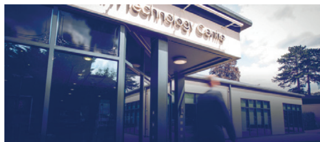
Watson-Marlows kontor i Helsinki.