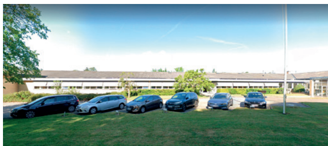
Watson-Marlows afdeling i Ringsted.